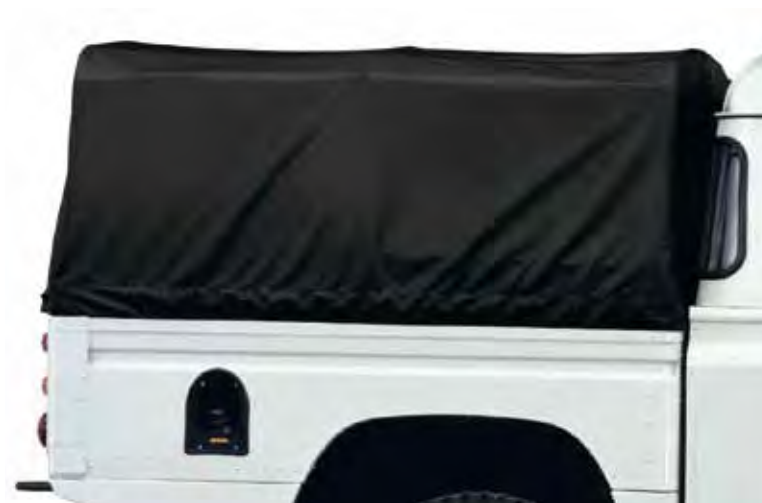
Zwarte huif over laadbak.