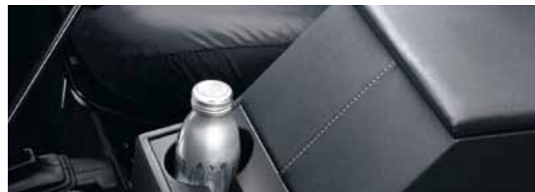
Opbergvak ('cubby box') met twee bekerhouders