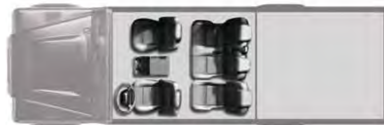
Interieurindeling Defender 130 Crew Cab. Afgebeeld bergvak tussen de stoelen ('cubby box') is optie.