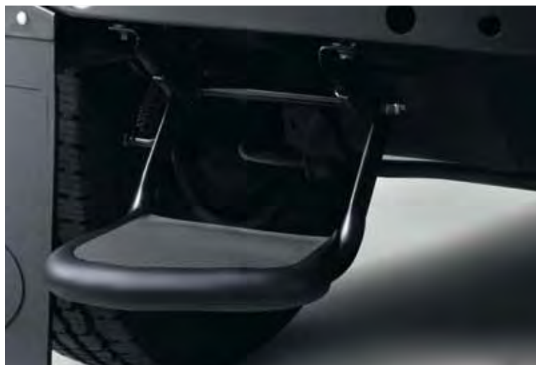
Opstap achter, opklapbaar.

1) Raadpleeg uw dealer over welke telefoons compatible zijn; functionaliteit kan variëren per model.