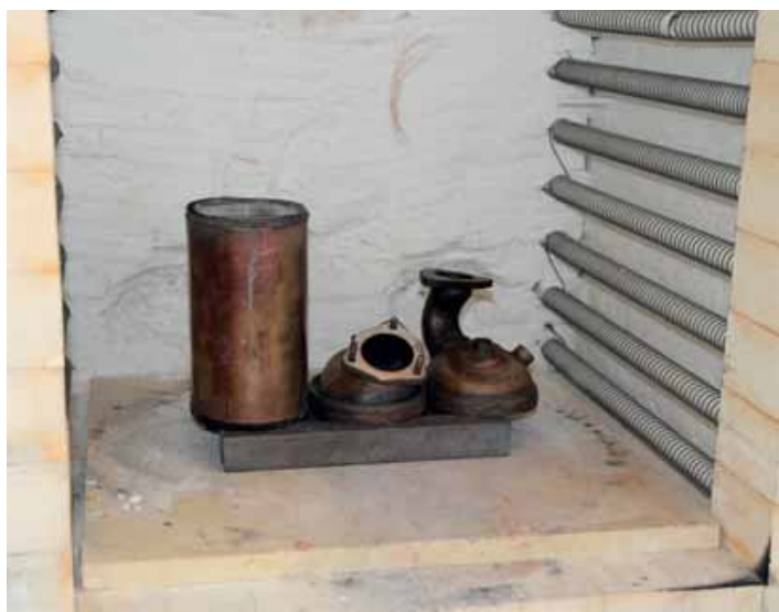
Filters die vervuld zijn met olie gaan bij Topcats en Diesel Büchli eerst in een oven om de olieresten te verbranden.

Het Ministerie van IenM doet samen met TNO, Bovag en RDW onderzoek naar de omvang van het probleem en mogelijke oplossingen. Binnen enkele maanden hopen we daar zicht op te hebben. De conclusie is duidelijk. Een roetfilter mag niet worden verwijderd en het motormanagement mag niet worden gemanipuleerd. Aangezien voorkomen beter is dan genezen doen autobedrijven er goed aan de consument voor te lichten. Weinig kilometers en veel korte ritten, dan liever geen diesel. Tenzij je regelmatig met een langere rit het filter de kans geeft te regenereren. Controle op verwijderde filters kan alleen als de APK-regelgeving strenger wordt. Dan zullen fabrikanten gevoeliger meetapparatuur gaan ontwikkelen. Die moet dan nog worden gecertificeerd. Voordat dit is gebeurd, zal er nog wel wat water door de Rijn stromen. Jammer, want volgens bijvoorbeeld MAHA is hun MPM4 viergastester (circa € 10.000,- ex. BTW), die met de laser strooilicht methode (LLSP) werkt, er geschikt voor. Ook TEN ziet geen problemen met betrekking tot ontwikkeling van nauwkeuriger apparaten.