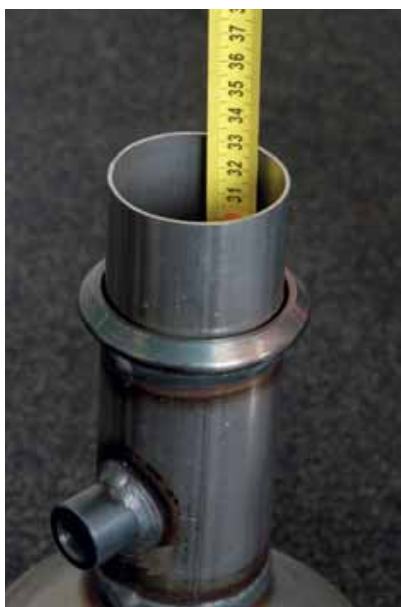
Hoe langer het filter, hoe beter de luchtdoorstroming en des te groter de capaciteit. Dit filter is goed.

Een niet beschadigd filter kan na uitbouw worden gereinigd. De prijzen daarvoor lopen uiteen van € 295,- tot € 375,- ex BTW. Hierna is een filter in principe weer als nieuw. Zowel Topcats als Diesel Büchli reinigen filters, maar elk op hun eigen wijze. Bij beide bedrijven hoef je de reiniging niet