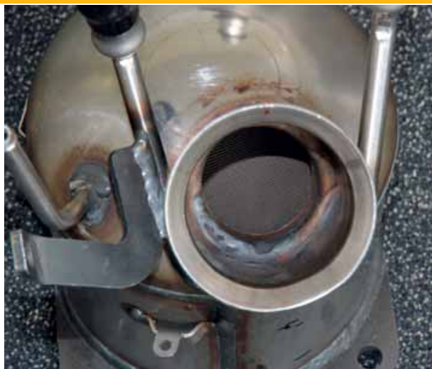
Bij dit filter zie je bij de lasnaad van de flens een weerstandverhogende vernauwing.

veelheid geproduceerd roet. Daarnaast worden nog andere parameters in de modelberekening ingevoerd, zoals motortemperaturen, motorbelasting en druk in het systeem. Aan de hand van die gegevens wordt het moment van regenereren bepaald. En daar is maar een zeer geringe hoeveelheid brandstof voor nodig. Het hele proces neemt vijf tot tien minuten in beslag. "Gemiddeld zal het meerverbruik door een filter (als gevolg van tegendruk en regenereren) bij 0,2 tot 0,3 l/100 km liggen.