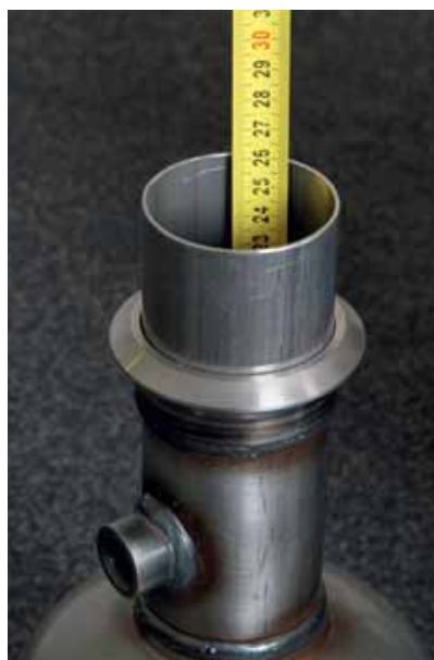
Filtermateriaal is duur. Door het c.a. 7 centimeter korter te maken, bespaart de fabrikant naar schatting tussen de € 50,- en € 100,-.