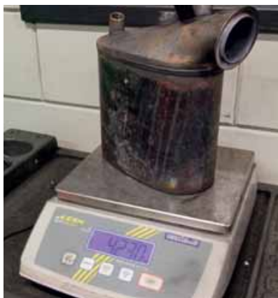
Een gereinigd filter blijkt 38 gram lichter te zijn geworden.

Dat er zeer hoge temperaturen in het filter kunnen optreden, bewijst dit exemplaar uit een Alfa Romeo 159 diesel. Het filtermateriaal is bestand tegen een temperatuur van 2500° C. Gezien de smeltschade is die waarde behoorlijk overtroffen. De oorzaak is in dit geval niet bekend.